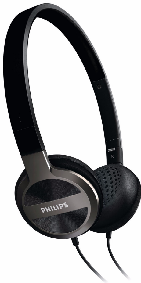
Philips Наушники с оголовьем