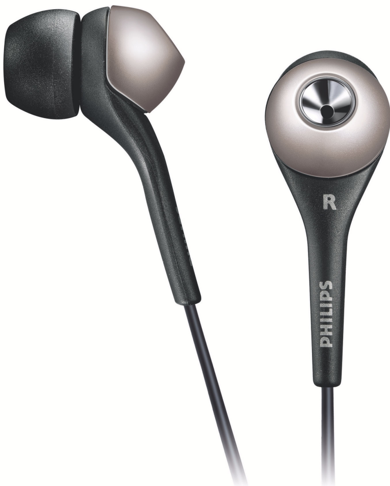
Philips Наушники-вкладыши с шейным ремешком