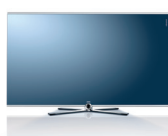
Table Stand , хромированное покрытие без стереоколонок: Ш 113,3/В 72,3/Г 6,0/ГО 8,5 со стереоколонок: Ш 113,3/В 82,7/Г 6,0/ГО 35,1

Floor Stand , Хром без стереоколонок: Ш 113,3/В 118,8/Г 6,0/ГО 52,4 со стереоколонок: Ш 113,3/В 118,8/Г 6,0/ГО 52,4