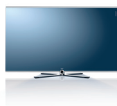
Table Stand , хромированное покрытие Ш 132,6/В 83,8/Г 6,0/ГО 39,2

Wall Mount WM 62 , Серебристый Хром без стереоколонок: